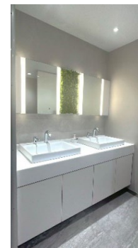
10F男女トイレリニューアル (2024/6)