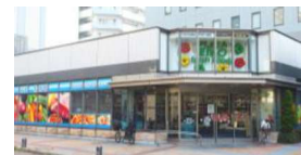
《プラザ栄光 生鮮館》

スーパーやキッチンカーでお 弁当を買って、ポートサイド 公園へ。水辺の木陰にあるベ ンチで自然に囲まれながら ゆったりランチもおススメ。