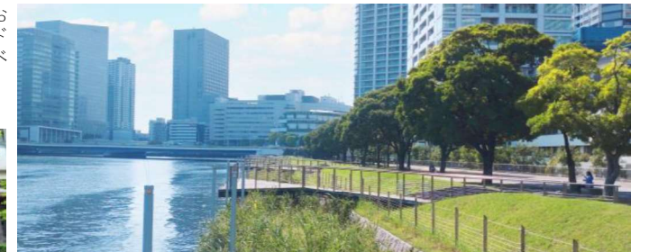
《ポートサイド公園》水辺沿いにベンチがたくさん設置されている